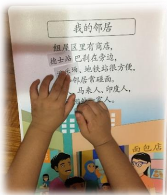
幼儿替换歌词唱儿歌。