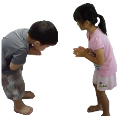
幼儿双手合十，弯腰行礼。