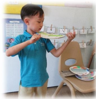
幼儿自制小提琴进行表演。