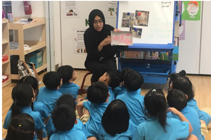
Guru menunjukkan sampel kraf.