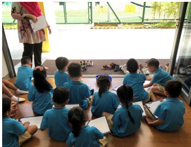
Kanak-kanak melukis serangga yang dijumpai di taman.