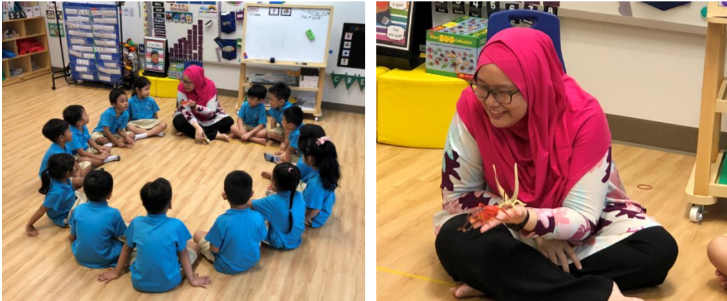
Kanak-kanak duduk dalam bulatan dan berbincang.